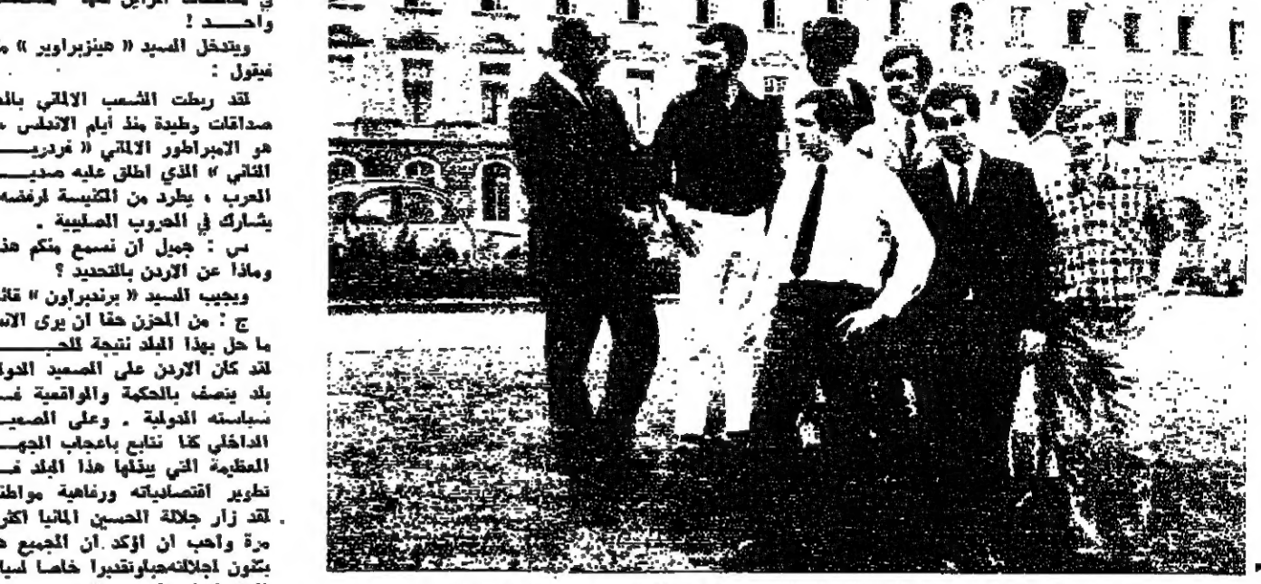
زعما حركة التطوع من اجل الالمان في جامعة بون يتبادلون الاحاديث في قاعة الجامعة

وقد بلغ عدد الذين سجلوا اسماهم للاطمان نحو ١٠٠ الف شخص في ألمانيا الغربية... (The text continues with details about the youth movement and its activities in West Germany.)